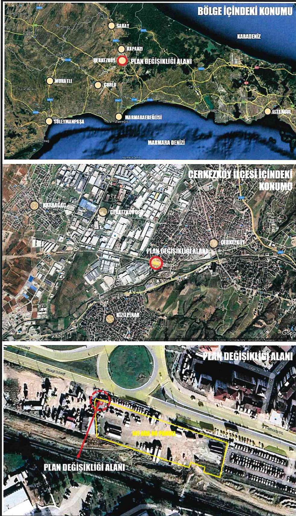
Resim 1: Plan Deęişikliği Alanına Ait Uydu Fotoęrafı

Plan deęişikliği alanı, Tekirdaę İli, Çerkezköy İlçesi, Fevzipaşa Mahallesi, 141 Ada, 86 Parsel numaralı taşınmazın 32 m 2 'lik kısmını kapsamaktadır (bkz. Resim 1).